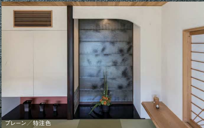
プレーン / 特注色