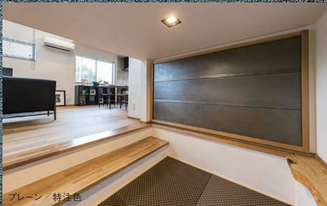
プレーン / 特注色