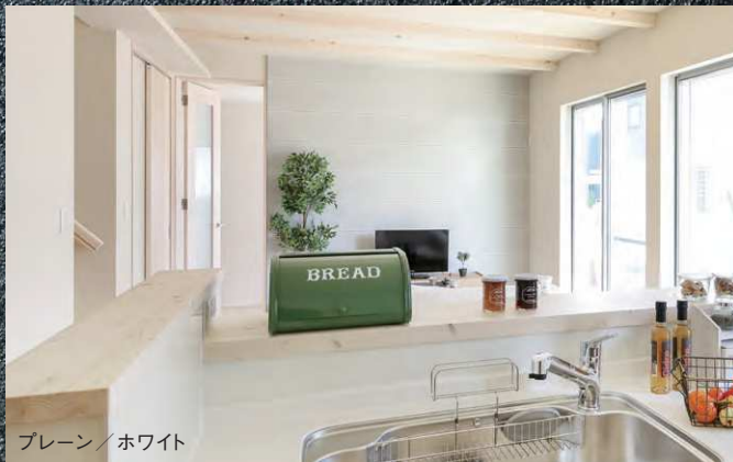
プレーン / ホワイト