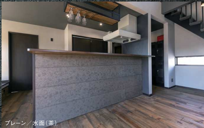
プレーン / 水面(茶)